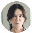
ЕЛЕНА ХАРЛАМОВА министр культуры Московской области

«Открытие выставки — одно из важных событий юбилейного года музея, отмечающего в 2020 году свое столетие. Усадьбы Подмоскowie хранят культурный код России. В них веками формировал-